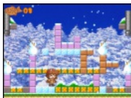
あゆあゆぱにつく